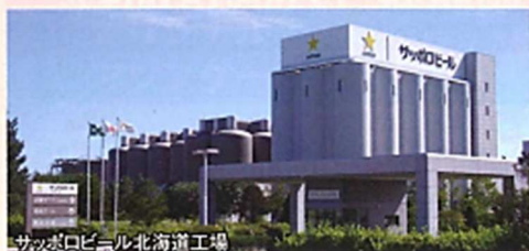
サッポロビール北海道工場